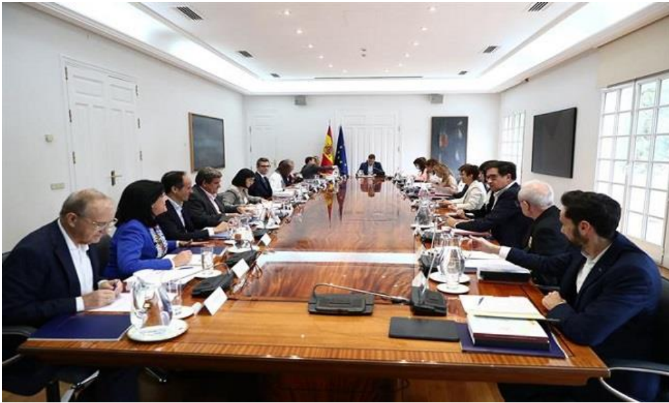
Réunion du Conseil de Sécurité Nationale 14/02/2023

en Espagne et notamment en ce qui concerne les conséquences sur la vie quotidienne de l'ensemble des citoyens.