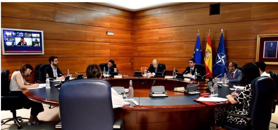
Reunión del Grupo de Trabajo de Recepción y Protección Temporal 27/06/2023.

Le mécanisme de protection temporaire de l’UE, qui a été activé le 4 mars 2022, a été automatiquement prolongé d’un an, jusqu’en mars 2024. Le 28 septembre 2023, le Conseil de l’Union européenne a décidé de prolonger la protection temporaire des personnes fuyant le conflit entre la Russie et l’Ukraine du 4 mars 2024 au 4 mars 2025. Le ministre de l’Intérieur espagnol en exercice a assuré que "l’UE soutiendra le peuple ukrainien aussi longtemps qu’il le faudra".