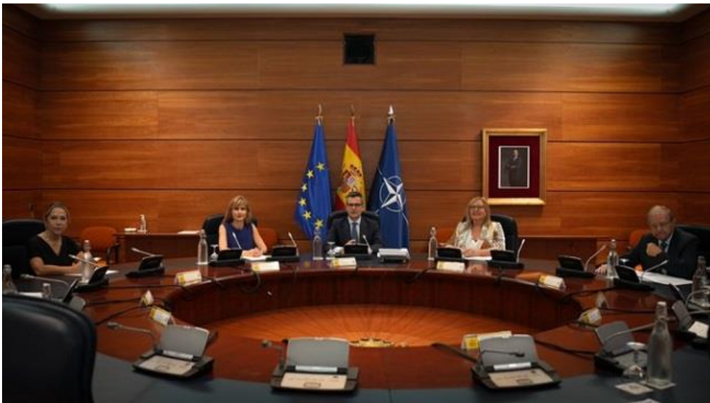
Réunion du Comité de Situation 03/10/2023

Depuis la mise en place de ces groupes de travail, différents départements ministériels et organismes, ayant des compétences dans leurs domaines respectifs, y participent. Cela permet d'assurer la coordination et le suivi de la situation ainsi que de la gestion de la crise et en même temps, de vérifier et accroître l'efficacité des mesures adoptées.