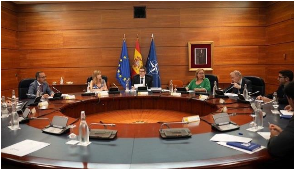
Réunion du Comité de Situation 27/06/2023

Depuis la mise en place de ces groupes de travail, différents départements ministériels et organismes, ayant des compétences dans leurs domaines respectifs, y participent. Cela permet d'assurer la coordination et le suivi de la situation ainsi que de la gestion de la crise et en même temps, de vérifier et accroître l'efficacité des mesures adoptées.