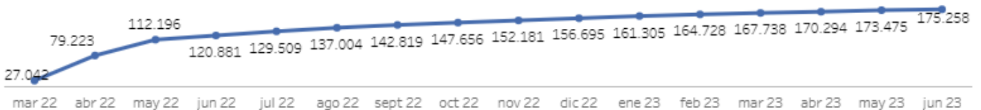
Evolución de extranjeros ucranianos. Diciembre 2021 - junio 2023 Ambos sexos. Total edad. Vía acceso residencia: Directiva de Protección Temporal

Dans ce contexte, les éléments les plus importants en Espagne sont les suivants :