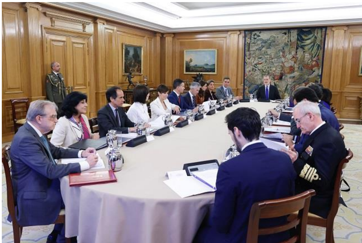
Réunion du Conseil de Sécurité Nationale 12/04/2023

De son côté, le Comité de Situation — le plus haut niveau de coordination, présidé par le ministre de la Présidence Felix Bolaños — s'est réuni jusqu'à vingt-trois fois à l'occasion de cette crise, la toute première ayant eu lieu le 2 février 2022. Lors de la dernière réunion, tenue le 27 juin 2023, l'état du conflit entre la Russie et l'Ukraine a été analysé, ainsi que ses répercussions dans différents domaines au niveau national et international.