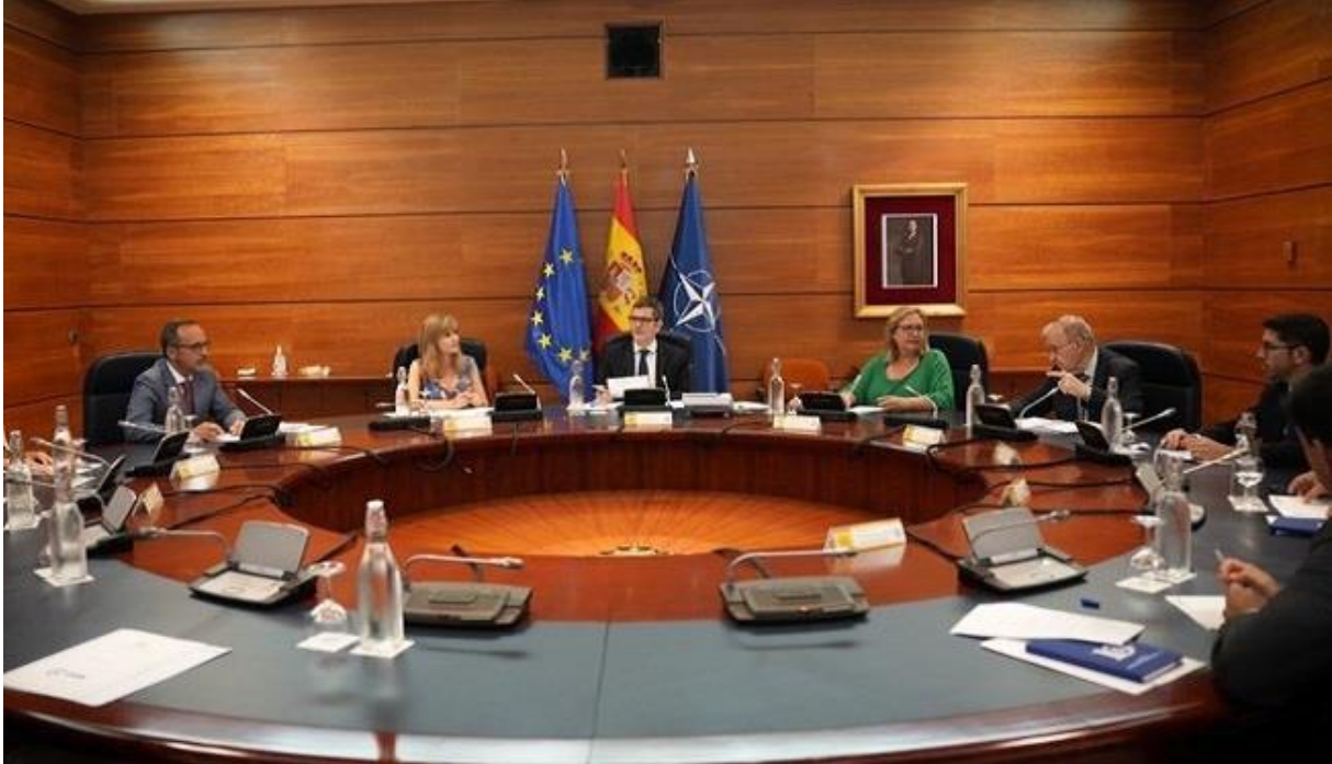
Réunion du Comité de Situation 27/06/2023

Depuis la mise en place de ces groupes de travail, différents départements ministériels et organismes, ayant des compétences dans leurs domaines respectifs, y participent. Cela permet d'assurer la coordination et le suivi de la situation ainsi que de la gestion de la crise et en même temps, de vérifier et accroître l'efficacité des mesures adoptées.