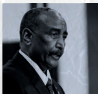
General Abdel Fattah al-Burhan

Graduado en la Academia Militar de Sudán (1991), al-Burhan combatió en el conflicto de Darfur y en la guerra secesionista del sur de Sudán. Fue comandante regional en Darfur, inspector general del Ejército y, en 2018, Al Bashir le nombró comandante de las Fuerzas Terrestres del Ejército. En 2019, en medio de las revueltas sociales, fue elevado al rango de teniente general y nombrado jefe de las Fuerzas Armadas de Sudán. Finalmente, tras decretar el encarcelamiento de Al Bashir y acercarse a los líderes sociales, fue designado presidente del Consejo Soberano de Sudán (gobierno civil-militar de transición). En octubre de 2021 lideró, junto a Hemedti , el golpe militar que acabó con el proceso de transición civil-militar. Desde entonces, es el presidente del Consejo de Soberanía de Transición.