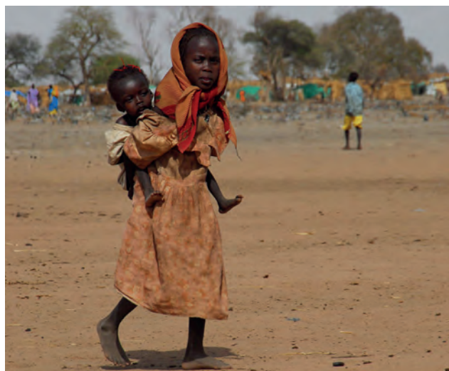
Una niña traslada a su hermana en un campo de refugiados próximo a la frontera con Egipto.

En este contexto, China, trascendental socio comercial y principal financiador de Sudán desde los noventa, se muestra reacia a involucrarse en los esfuerzos de paz, pero intentará trabajar con un nuevo gobierno para preservar la estabilidad y su enorme inversión en infraestructuras sudanesas, especialmente petroleras. Finalmente, Arabia Saudí y